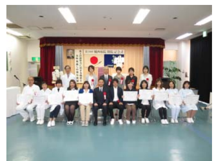
表彰者の記念撮影